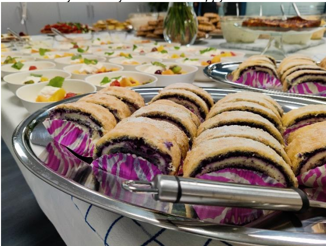
(Kuva vuoden 2021 Asiakkailla avoimilta Tekstiilipäiviltä.)

Tänä vuonna meillä onkin juhlakahvien paikka, sillä Sanomat täyttävät nyt keväällä 2024 pyöreät 10 vuotta!